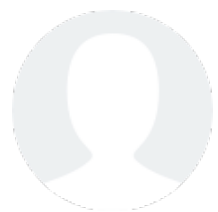
Aurélie BERNARDET NOËL

EN EXCLUSIVITÉ - IMMEUBLE DE RAPPORT AVEC PARKING, JARDIN ET TERRASSE secteur Mainvaux - Prise de rdv pour les visites uniquement par téléphone - Immeuble composé de quatre appartements loués : -AU RDC : F2 avec Jardin et place de parking 41m 2 loué 475 +65. -Au 1er : F3 avec Place de parking 61m 2 loué [...]